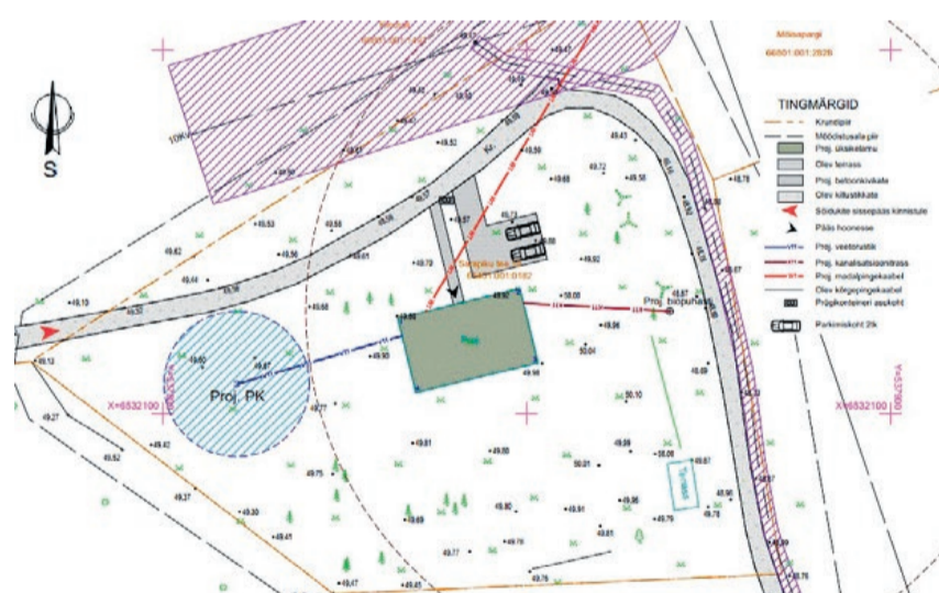
Sarapiku tee 10 asendiplaan (autor arhitekt Liis Vavulski).

Kaiu alevikus Kasvandu tee 11 maaüksuse loodeossa soovitakse püstitada u 140 m 2 abihoone, milles on garaaž ja abiruumid. Taotluse kohaselt kavandatakse modernset lahendust.