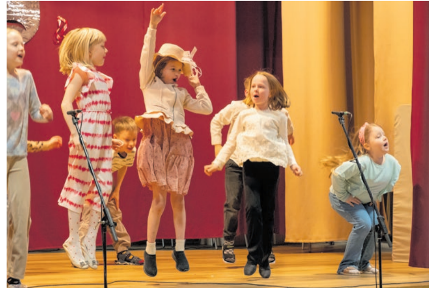
1. klassi õpilased.

Publikule pakkusid suurt rõõmu ka lauludel põhinevad etteasted: nii