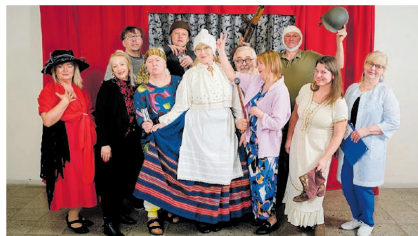
Festivali laureaat Kuimetsa harrastusteater IDU.