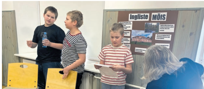
3. klassi stendiettekanne.

3. klassi õpilased olid valmistanud kunstitudides ette stendiettekanded ümbruskaudsetest mõisatest ja vastasid entusiastlikult kõigile küsimustele. 5. klass tutvustas Juuru ümbruses asuvaid muinsuskaitseobjekte ning 7. klassi õpilased andsid informaatikatumnis viimistletud klassikalise esitluse vormis ülevaate ümbruskonnast küladest. Õpetaja Kalev Kask kiitis eriti 3. klassi õpilaste julgust ja põhjalikkust.