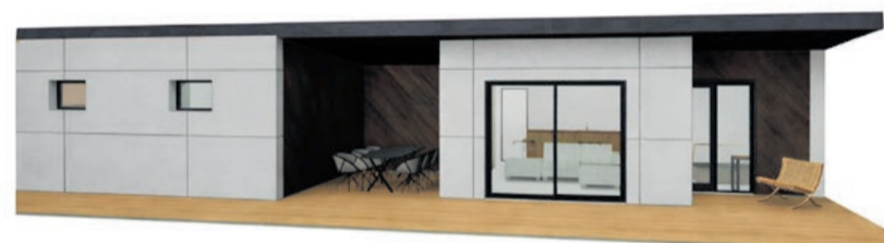
Kasvandu tee 11 abihoone eskiis (autor sisekujundaja Jana Ribelis).

Rapla linnas Saare tn 7 maaüksuse lääneossa soovitakse püstitada piirkonda sobiv üksikelamu. Taotleja ei ole elamu üksikasju avaldanud. Esitatud on asendiplaan.