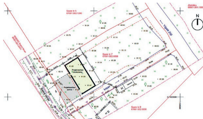
Saare tn 7 asendiplaan (autor arhitekt Jelena Truusa).

Avaliku väljapaneku periood on 12.–26. aprillini 2026 . Avalikutamise jooksul on valla e-posti aadressile rapla@rapla.ee oodatud arvamused ja ettepanekud eelnõule. Kui ettepanekuid ei esitata või on kõiki ettepanekuid võimalik arvestada, otsustatakse asi ilma avalikul istungil arutamata.