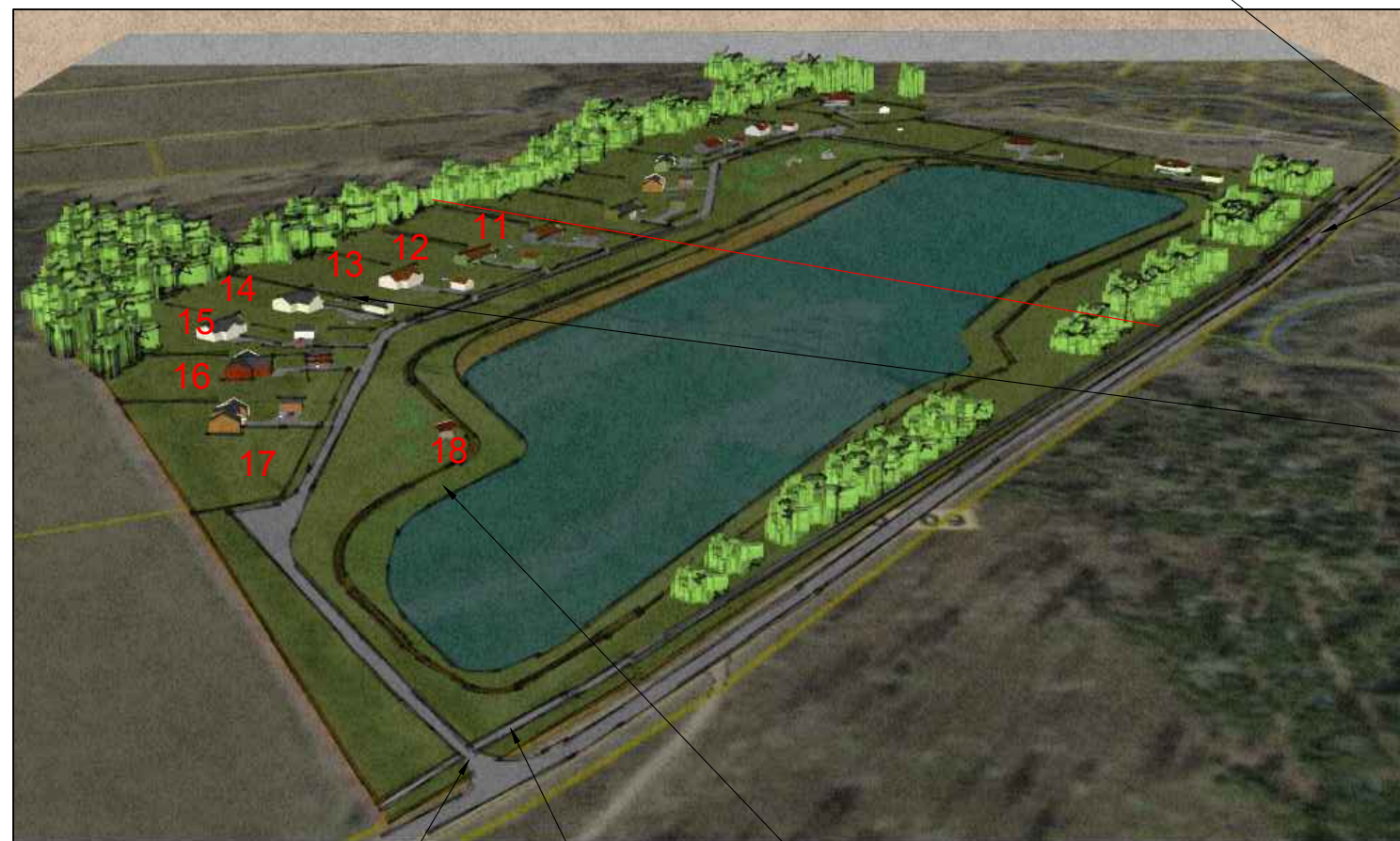
Juurdepääs - planeeritud mahasõit riigiteelt