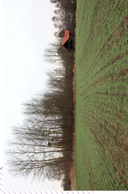
Foto 1. Vaade planeeritavale alale