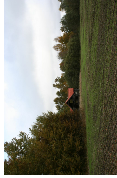
Foto 4. Vaade planeeritavale alale