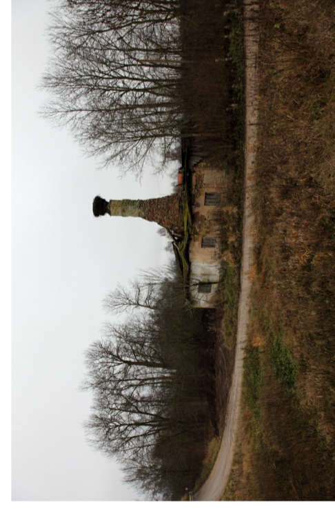
Foto 3. Vaade planeeritavale alale