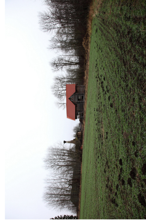
Foto 2. Vaade planeeritavale alale