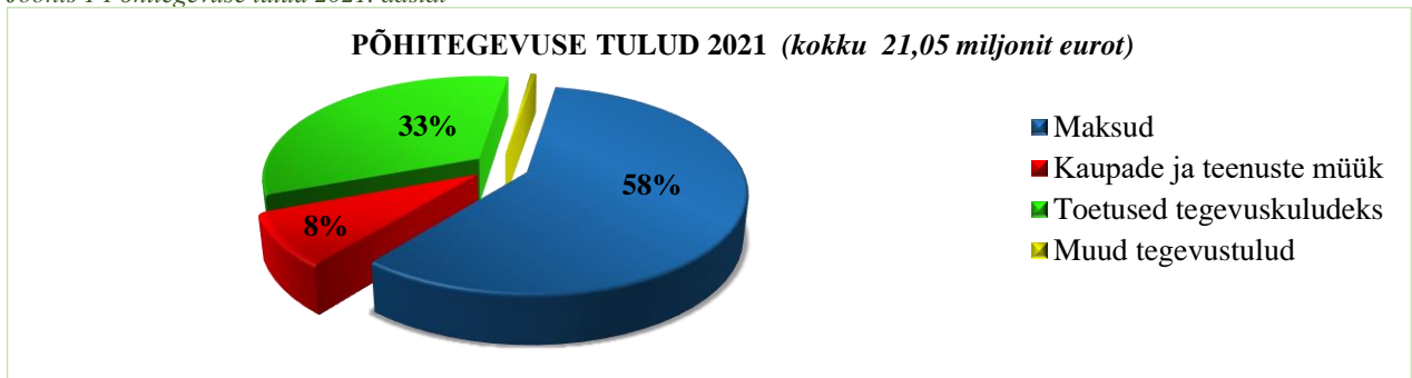
Joonis 1 Põhitegevuse tulud 2021. aastal