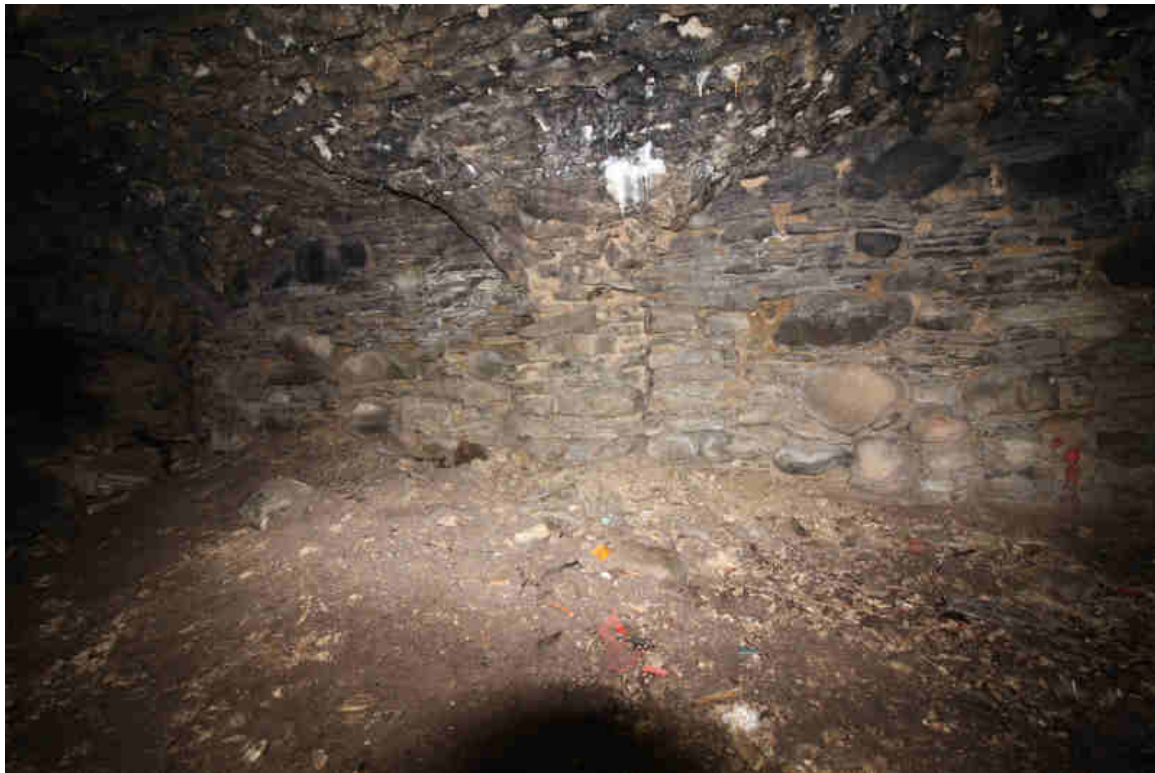
Foto 6. Vaade kinnimüüritud käigule. Käigu võlvi sillusest on kivid osaliselt välja kukkunud