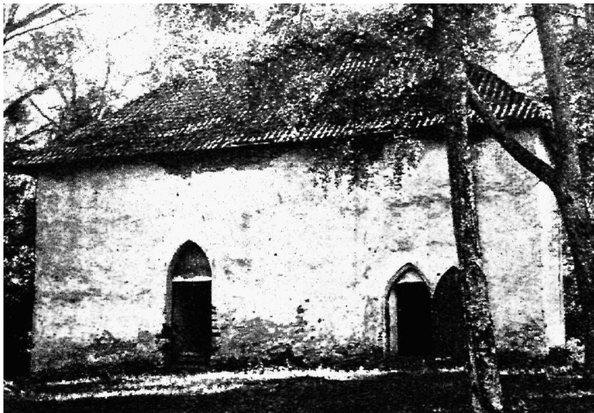
Foto 2. Hoone tänaseni säilinud keldri välisvaade.