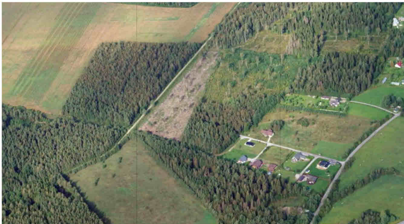
Maa-ameti fotolao ülesvõte 05.09.2019