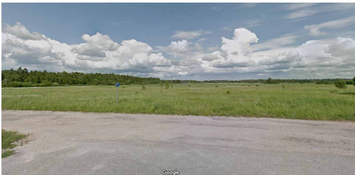
Foto 1. Vaade planeeringualale läänest Kalmistu parkla maaüksuselt (foto jäädvustatud 06.2011, GoogleMaps).

Planeeringuala maapind on tasane (foto 1), maapinna absoluutkõrgused jäävad vahemikku 58-62 m, maapinna üldine kallakus on valdavalt Aranküla peakraavi suunas ning maa-ala piires on kõrgemaks kohaks maaüksuse loodenurk, kus drenaaž puudub ja kõrghaljastus on moodustatud noortest mändidest ja kaskedest. Mujal leidub ka üksikuid leht- ja okaspuude ning põõsastike gruppe.