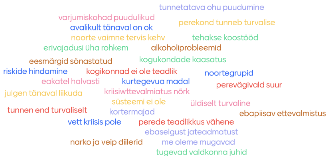
Joonis 1. Rapla valla turvalisuse hinnangu põhjendused sõnapilvena

Seminari turvalisuse teemalise arutelu käigus hinnati individuaalse küsimuse kaudu esmalt osalejate tajutatavat turvalisust nende kohalikes omavalitsustes. Vastustest ilmnas, et keskmine hinnang Rapla valla turvalisusele oli 3,8 punkti (1 – väga halb ... 5- väga turvaline) viiepallisüsteemis, mis peegeldab üldist positiivset suhtumist, olles kõige kõrgeim hinnang, mis osalevates KOVides on turvalisusele antud. 1 Osalejad tõid positiivsena välja üldise turvatunde enda ja oma perekonna osas – kuritegevus on madal, puudub tunnetatav oht ja tänavatel on julge liikuda. Samuti põhjendatakse hinnangut turvalisusele tugevate valdkonnajuhtide olemasolu, sõnastatud eesmärkide, koostöö ning kogukondade kaasatusega.